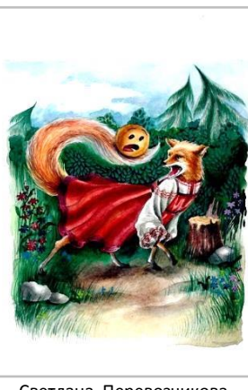
Светлана Перевозчикова - 2 место